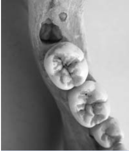
Abb. 3: Weisheitszahn des Unterkiefers im Zahnfach hinter dem zweiten Backenzahn.

Behandlerin/Behandler nach Ihrer speziellen Befundlage aussprechen wird. Es bestehen aber eine Reihe von Anhaltspunkten aus der wissenschaftlichen Fachliteratur und aus der Diskussion von Expertengruppen, die einen Rahmen für diese Empfehlung bilden.